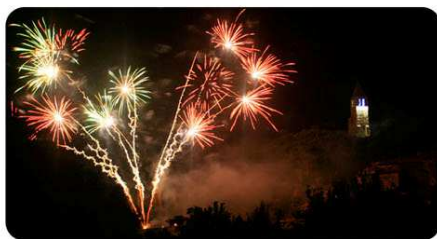
Festibaloche, V. 7 au D. 9 août