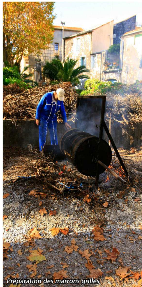
Préparation des marrons grillés