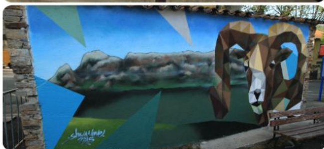
Graffs (intérieur et extérieur) sur l'abri-bus devant la mairie,