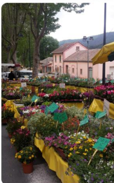
Fête de la brouette arrosée, D. 8 mai

Quel beau succès pour l'Épic enduro les 9 et 10 avril derniers à Olargues : 720 inscrits et 620 au départ et 40 pour le kids enduro.